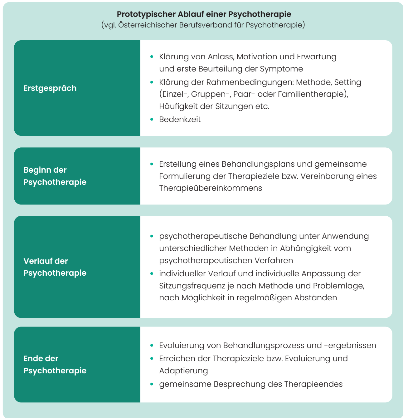
Abbildung 1: Prototypischer Ablauf einer Psychotherapie