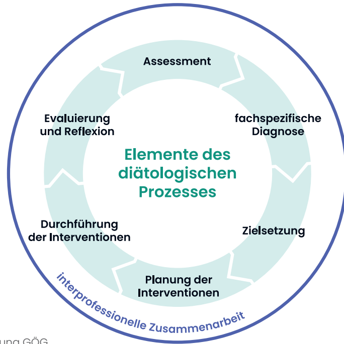
Abbildung 1: Elemente des diätologischen Arbeitsprozesses